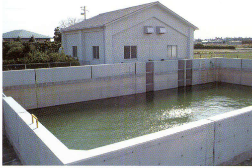
尼ヶ崎西(竜洋)工区ポンプ場(竜洋町東平松地内)