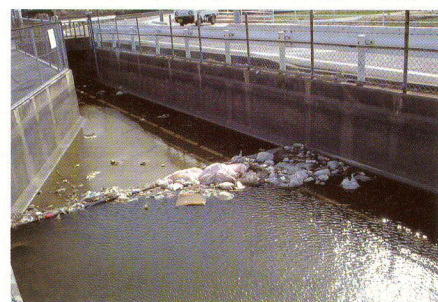
毎年通水前にはこのような状態になります。

自動車事故など不注意によりフェンスなどを壊してしまったときは、当土地改良区まで連絡してください。また、見かけた方はご一報ください。