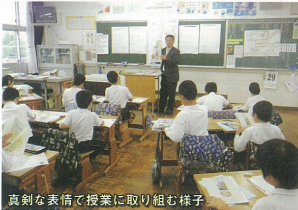
真剣な表情で授業に取り組む様子