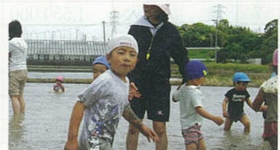
豊田第三保育所の「どろんこ遊び」