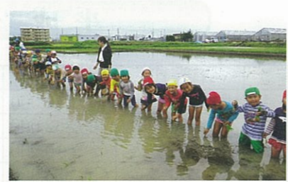
磐田南幼稚園の「田植え体験」